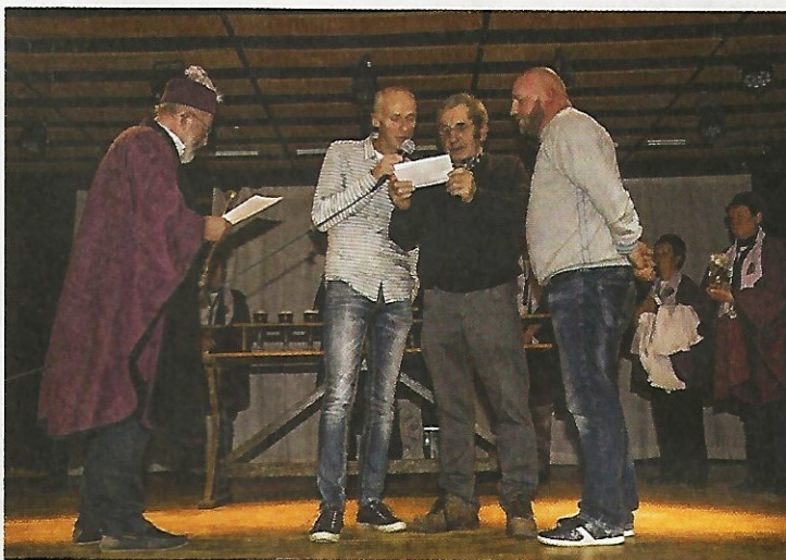
Confrérie de Soiron